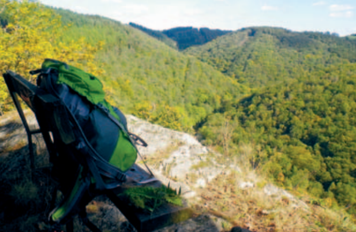
Uitzicht boven de Ourthevallei